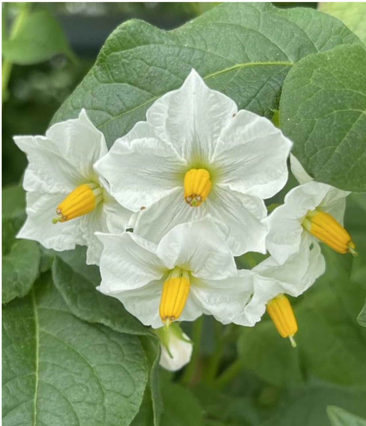
NGB 24298 'Metsälä'.